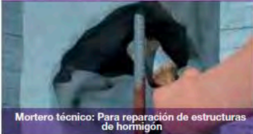
Mortero técnico: Para reparación de estructuras de hormigón