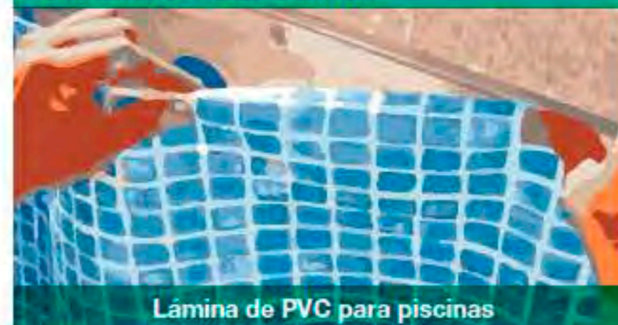
Lamina de PVC para piscinas