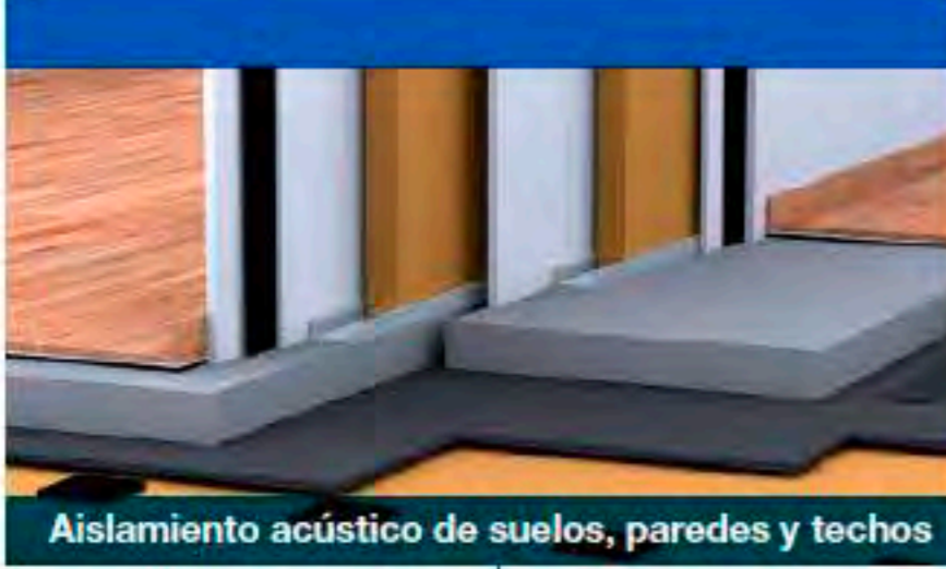
Aislamiento acústico de suelos, paredes y techos