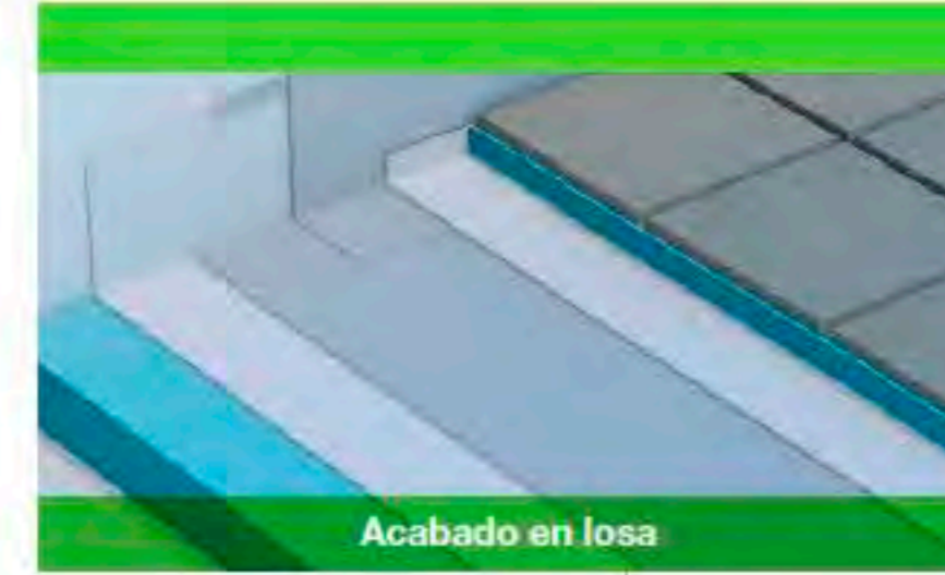
Acabado en losa