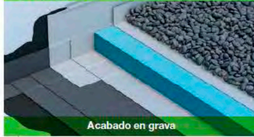
Acabado en grava