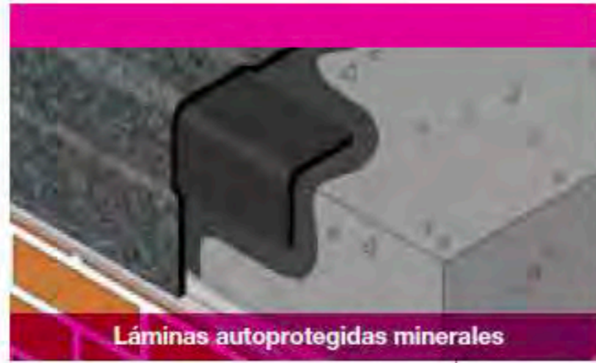
Láminas autoprotegidas minerales