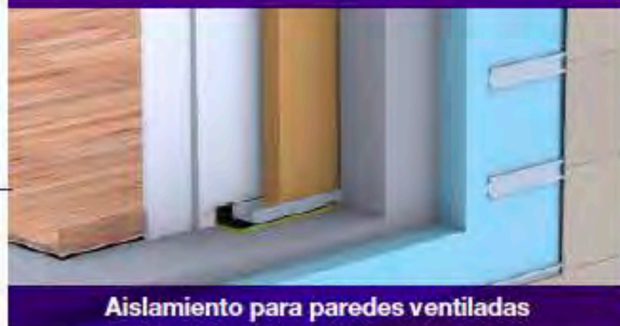
Aislamiento para paredes ventiladas