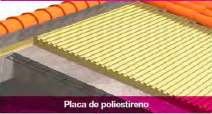
Placa de poliestireno