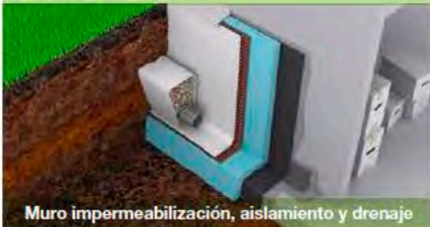
Muro impermeabilización, aislamiento y drenaje