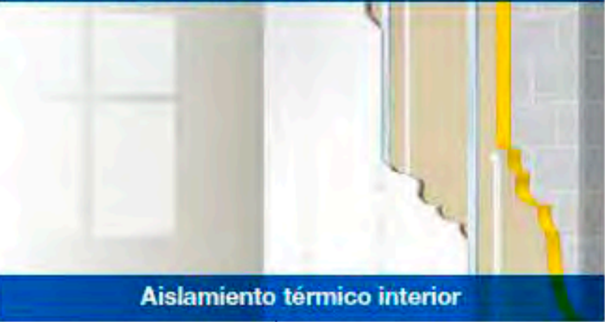
Aislamiento térmico interior