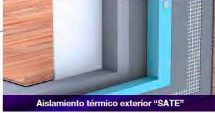
Aislamiento térmico exterior "SATE"